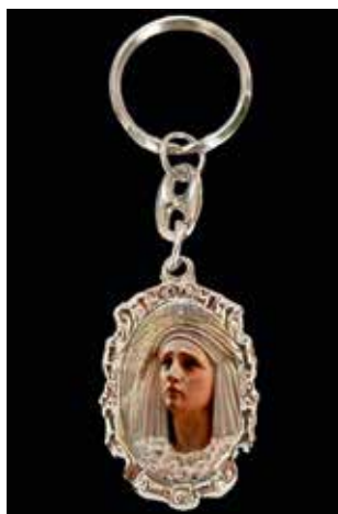
LLAVERO Donativo 3€