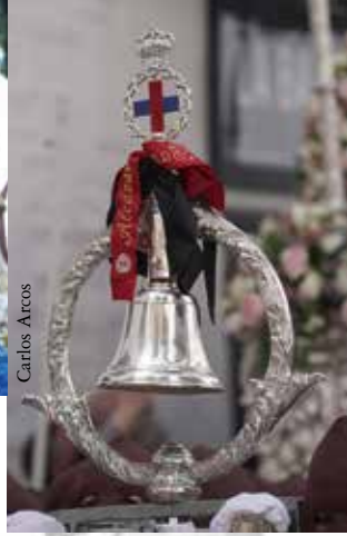
Isabel y Pedro Fotografía