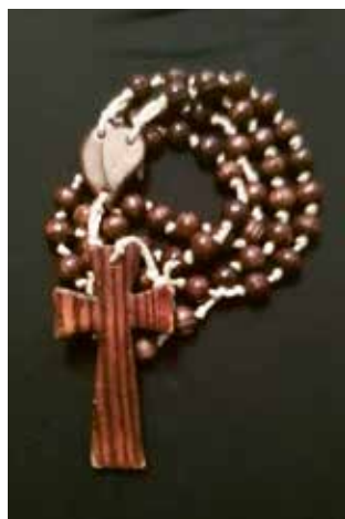
ROSARIO GRANDE DE MADERA Donativo 18€