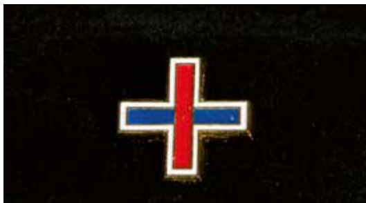
PIN Donativo 3€