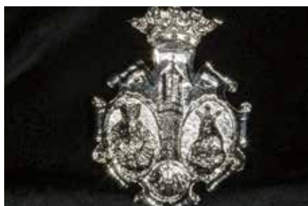
MEDALLA + CORDÓN