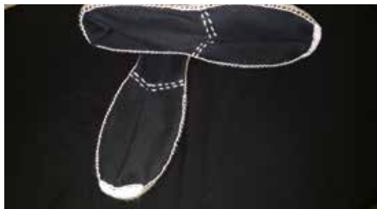
ESPARTEÑAS Donativo 10€